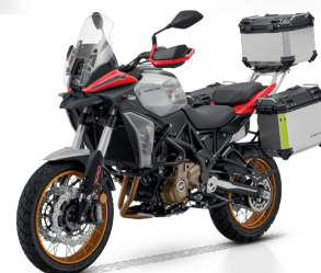
Silber / Rot