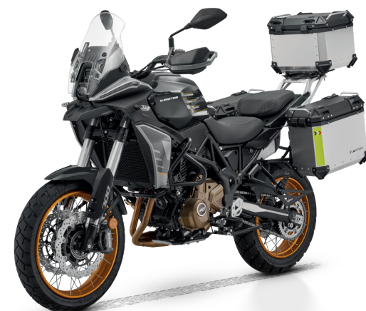
Schwarz / Silber