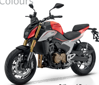
Silber / Rot